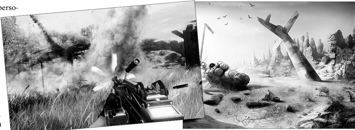
La acción en el 'personal shooter' de Xbox 360 se desarrolla en África.

Pero una vez se inicia el juego, Ubisoft nos deja ante una misión que nos enfrentará a enemigos espontáneos, entornos destructibles completamente, un fuego que se puede propagar de forma incontrolable – una de las opciones que más sorprenden – y cambios en el