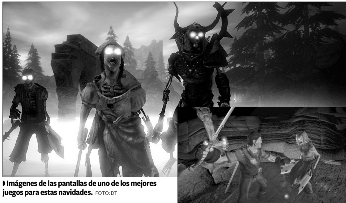
Imágenes de las pantallas de uno de los mejores juegos para estas navidades.

Creado por Peter Molyneux, este juego de Lionhead Studios nos permite jugar a ser el héroe o el villano de la historia. Y es que Fable II deja, realmente, elegir el destino y su modo de vida mediante continuas decisiones morales entre el Bien y el Mal. Además todo este entramado de posibilidades, así como el perro que acompaña en todo momento al protagonista y le ayuda en su aventura, se sustentan en un alto nivel de la IA.